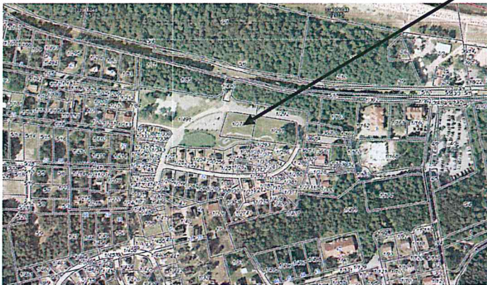
Der Geltungsbereich ist im Luftbild hinweislich dargestellt